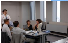
あしんの年間3000社の参加実績

●将軍の日の由来・・・戦国時代に将軍は戦場から少し離れたところから、戦況を見ながら戦略戦術を練ったことにちなみ、経営者が日常業務から離れ電話も来客もない環境で経営計画を作るこのセミナーを「将軍の日」と名付けました。