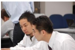
プロがマンツーマンでサポート